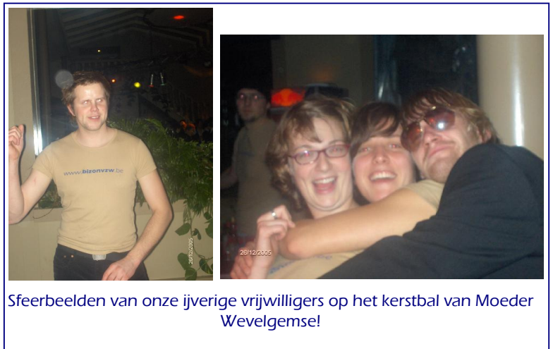
Sfeerbeelden van onze ijverige vrijwilligers op het kerstbal van Moeder Wevelgemse!